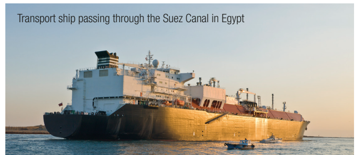
Transport ship passing through the Suez Canal in Egypt