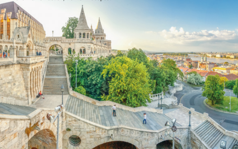
Fisherman's Bastion, view on Budapest

InterGest Hungary was formed in 2001 to assist foreign companies in establishing and developing their business activities in Hungary.