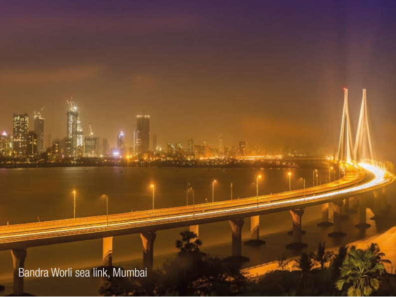
Bandra Worli sea link, Mumbai

InterGest South Asia was formed in 2007 to assist foreign companies in establishing and developing their business activities in India.