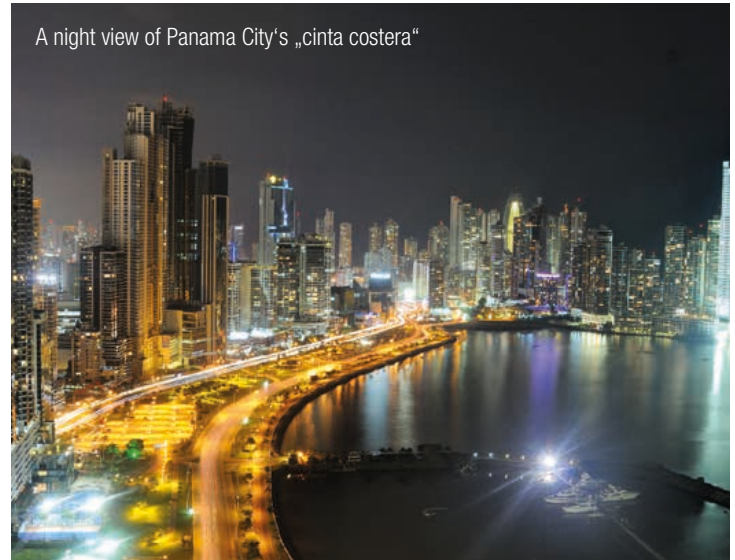
A night view of Panama City's „cinta costera“

Our competent InterGest partners will assist you in over 50 countries, from Canada to New Zealand, where a team of around 750 employees currently provides consulting services to approximately 1,700 branches of international companies.