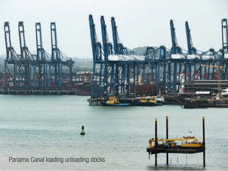
Panama Canal loading unloading docks