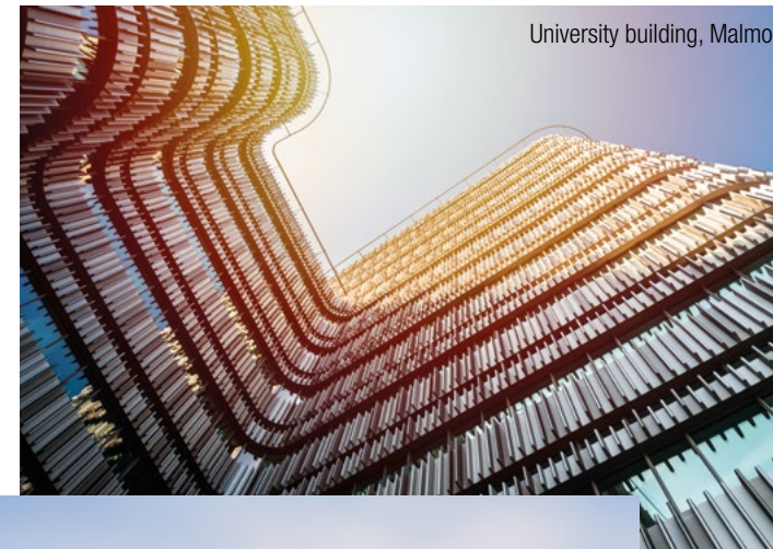
University building, Malmö

Our experienced InterGest partners will assist you in over 50 countries, from Canada to New Zealand, where a team of around 750 employees currently provides consulting services to approximately 1,700 branches of international companies.