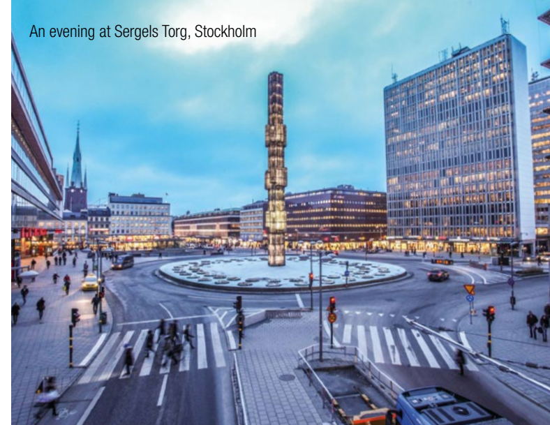
An evening at Sergels Torg, Stockholm

InterGest Sweden assists foreign companies in establishing and developing their business activities in Sweden and the Nordic region. Our services and systems are designed to assist our clients in developing an optimum concept for the establishment and administration of a branch or subsidiary in Sweden and this with one contact person.