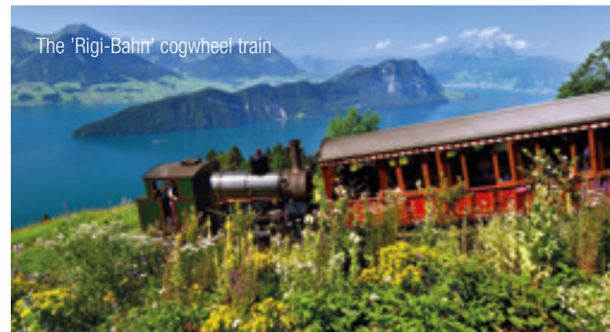
The 'Rigi-Bahn' cogwheel train

Our experienced InterGest partners will assist you in over 50 countries, from Canada to New Zealand, where a team of around 750 employees currently provides consulting services to approximately 1,700 branches of international companies.