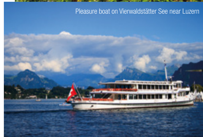
Pleasure boat on Vierwaldstätter See near Luzern