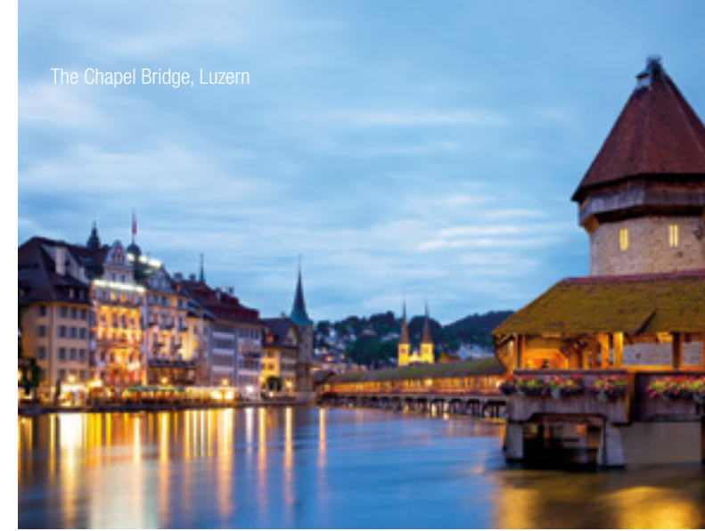
The Chapel Bridge, Luzern

InterGest Switzerland was formed in 2001 to assist foreign companies in establishing and developing their business activities in Switzerland.