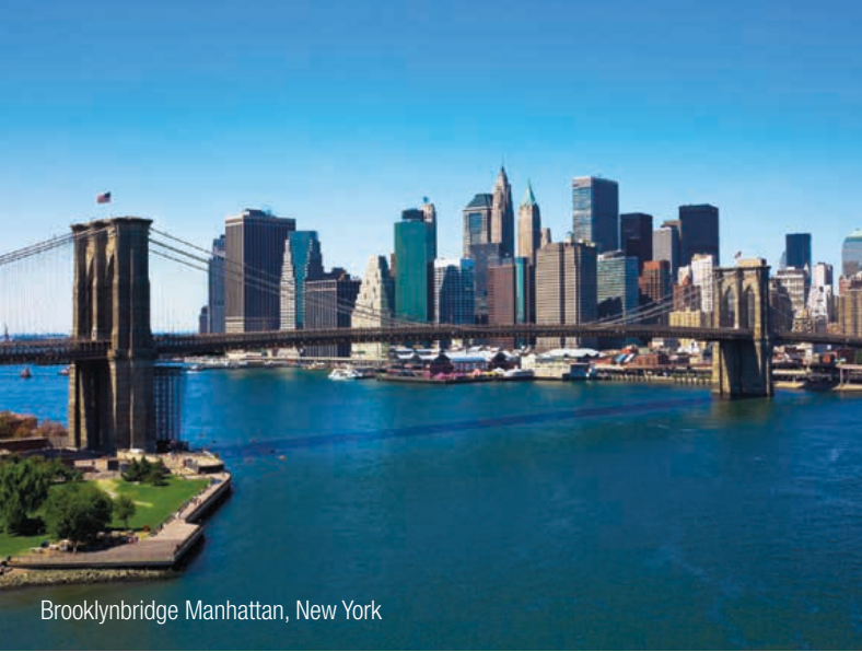
Brooklynbridge Manhattan, New York

InterGest North America was formed in 1997 to assist foreign companies in establishing and developing their North America business activities in the USA.