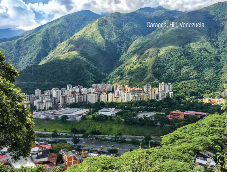
Caracas, Hill, Venezuela

InterGest Venezuela was formed 2004 to assist foreign companies in establishing and developing their business activities in Venezuela, offering administrative support to international companies, assisting in the coordination of their business and solving any legal, personnel taxation matters which normally arise.