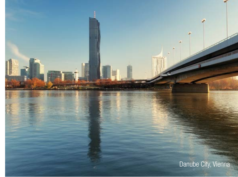
Danube City, Vienna