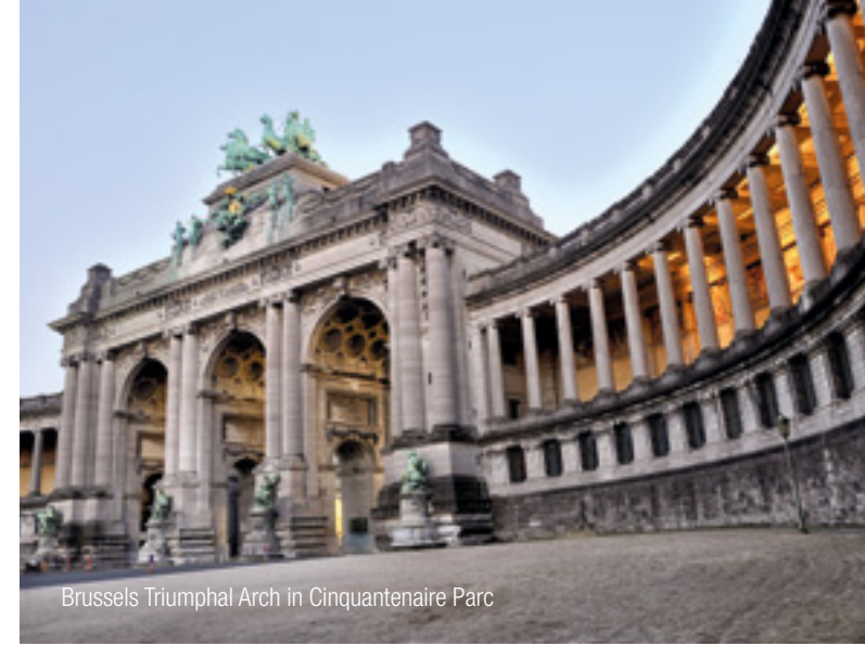
Brussels Triumphal Arch in Cinquantenaire Parc