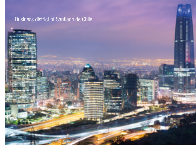
Business district of Santiago de Chile

InterGest Chile was formed in 2008 to assist foreign companies in establishing and developing their business activities in Chile.