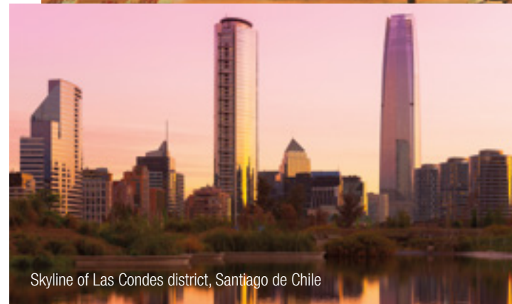
Skyline of Las Condes district, Santiago de Chile