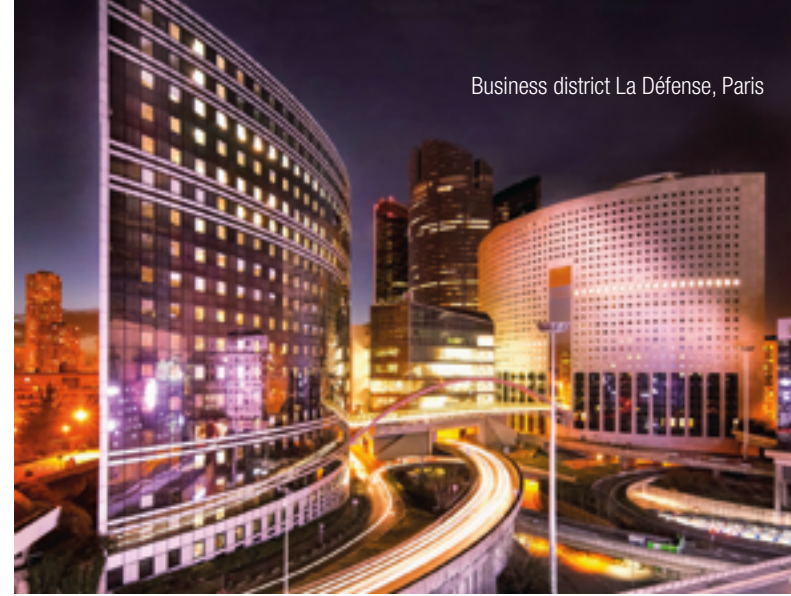
Business district La Défense, Paris

With the establishment of InterGest France in 1972, the foundation for a global consulting network was laid. Today France remains Germany's most important export market, even more relevant than the US or China. With more than 40 years of experience and an in-depth understanding of regional conditions, our local partners provide comprehensive business support at every level.