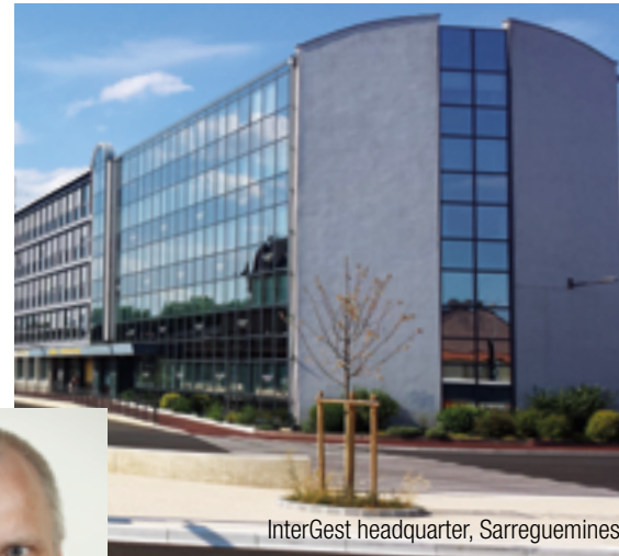
InterGest headquarter, Sarreguemines

Our competent InterGest partners will assist you in over 50 countries, from Canada to New Zealand, where a team of around 750 employees currently provides consulting services to approximately 1,700 branches of international companies.