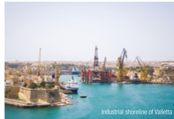
Industrial shoreline of Valletta

Our experienced InterGest partners will assist you in over 50 countries, from Canada to New Zealand, where a team of around 750 employees currently provides consulting services to approximately 1,700 branches of international companies.