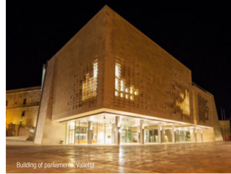
Building of parliaments, Valletta