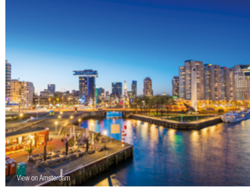
View on Amsterdam