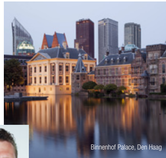
Binnenhof Palace, Den Haag

Our experienced InterGest partners will assist you in over 50 countries, from Canada to New Zealand, where a team of around 750 employees currently provides consulting services to approximately 1,700 branches of international companies.