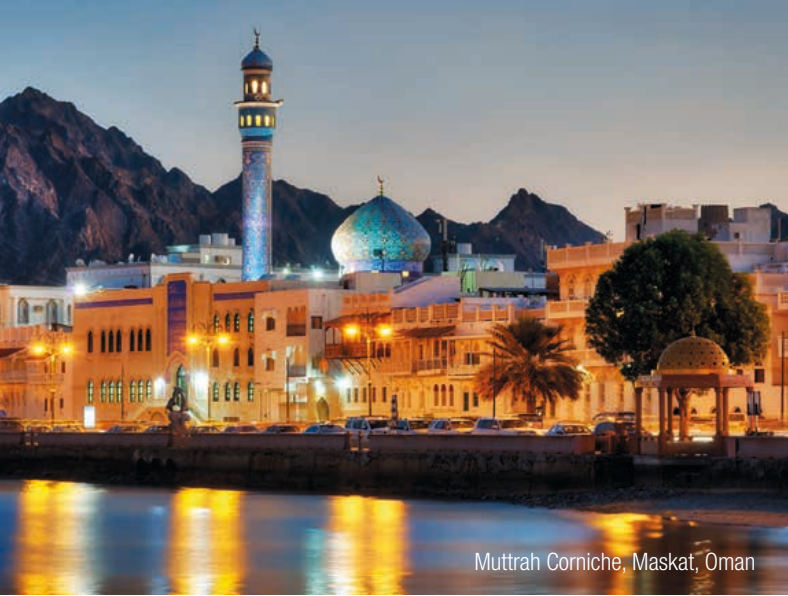
Muttrah Corniche, Maskat, Oman

InterGest Oman was formed in 2023 to assist foreign companies in establishing and developing their business activities in Oman.