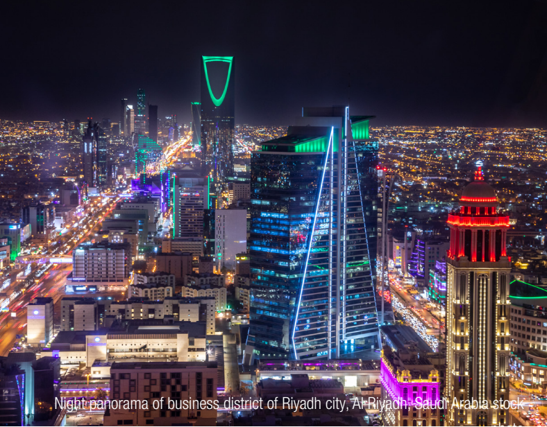
Night panorama of business district of Riyadh city, Al Riyadh - Saudi Arabia stock

InterGest Saudi Arabia was established in 2025 to support international companies in successfully setting up and expanding their business activities in the Kingdom of Saudi Arabia. Our office in Ishbilyah, Riyadh, is strategically located on Al Imam Abdullah Bin Saud Bin Abdul-Aziz Road, providing direct access to key resources and decision-makers. With our deep local expertise, we ensure your company achieves sustainable success in this dynamic market.