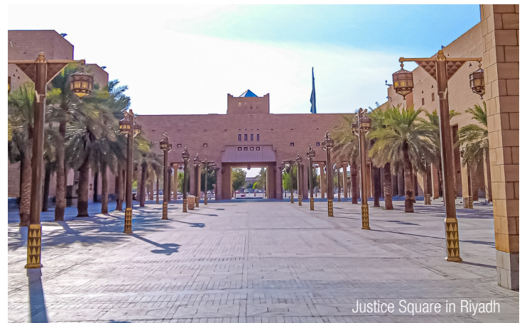
Justice Square in Riyadh

Ein Erstgespräch ist grundsätzlich kostenlos und unverbindlich. Ziel ist es, dass wir mehr über Ihre Pläne in Oman erfahren. Sie entscheiden dann, ob wir der richtige Partner für Sie sind.