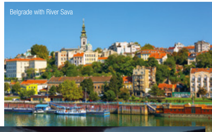
Belgrade with River Sava

Our experienced InterGest partners will assist you in over 50 countries, from Canada to New Zealand, where a team of around 750 employees currently provides consulting services to approximately 1,700 branches of international companies.