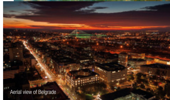
Aerial view of Belgrade