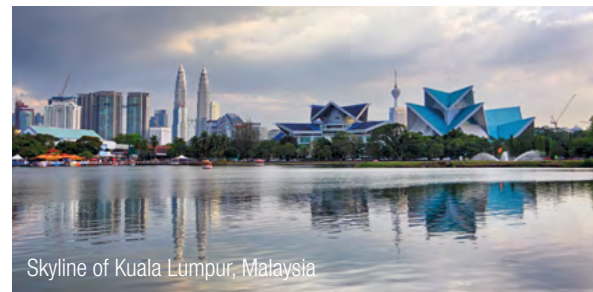
Skyline of Kuala Lumpur, Malaysia

Our experienced InterGest partners will assist you in over 50 countries, from Canada to New Zealand, where a team of around 750 employees currently provides consulting services to approximately 1,700 branches of international companies.