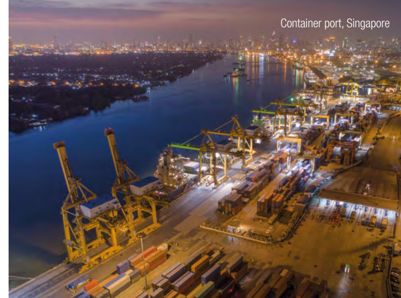
Container port, Singapore