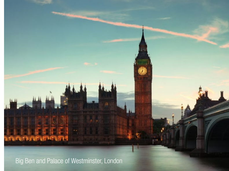
Big Ben and Palace of Westminster, London