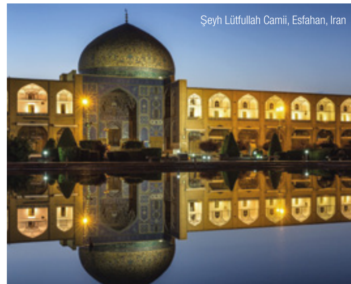
Şeyh Lütfullah Camii, Esfahan, Iran