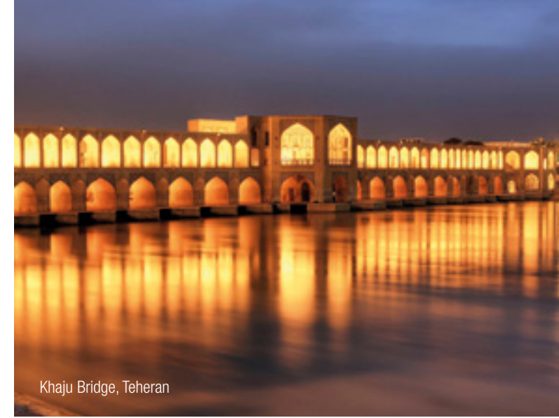
Khaju Bridge, Teheran

InterGest Iran was formed in 2016 to serve foreign companies in establishing and developing their business activities in Iran.