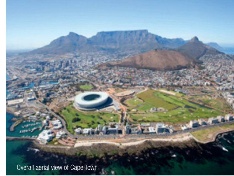
Overall aerial view of Cape Town