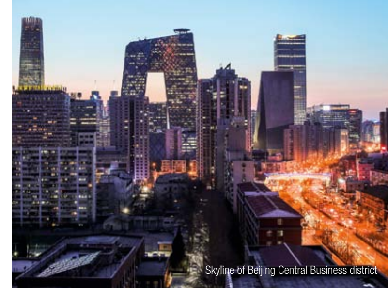
Skyline of Beijing Central Business district