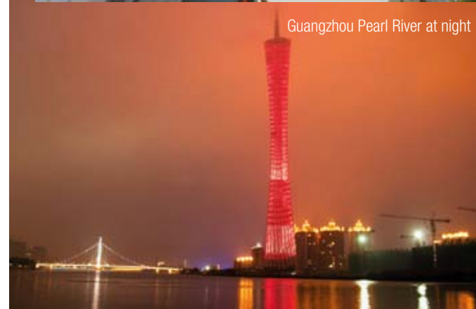
Guangzhou Pearl River at night