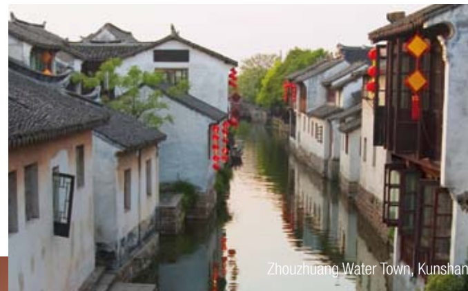
Zhouzhuang Water Town, Kunshan

Our competent InterGest partners will assist you in over 50 countries, from Canada to New Zealand, where a team of around 750 employees currently provides consulting services to approximately 1,700 branches of international companies.