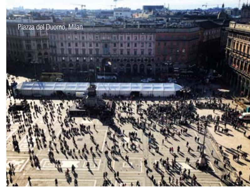
Piazza del Duomo, Milan