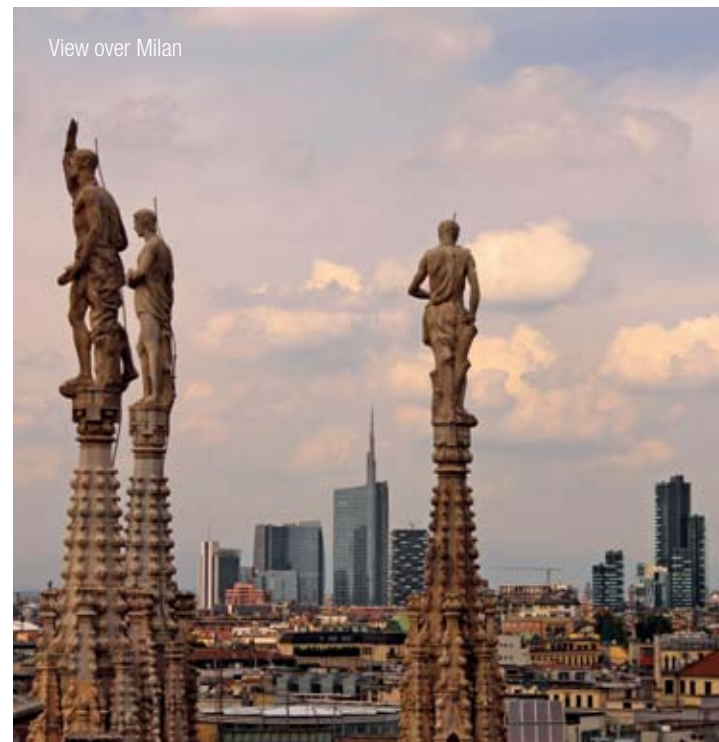
View over Milan

Our competent InterGest partners will assist you in over 50 countries, from Canada to New Zealand, where a team of around 750 employees currently provides consulting services to approximately 1,700 branches of international companies.