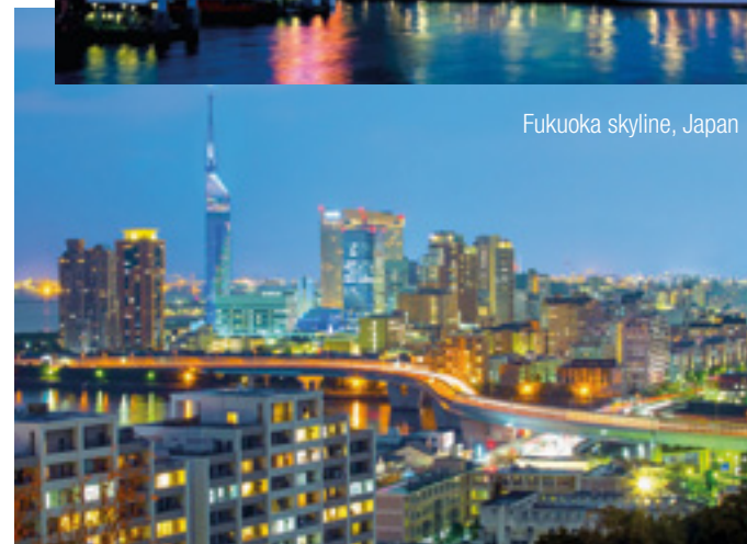
Fukuoka skyline, Japan