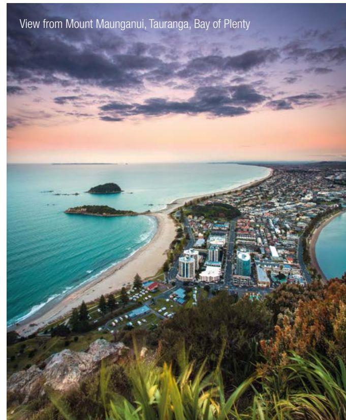
View from Mount Maunganui, Tauranga, Bay of Plenty

Our experienced InterGest partners will assist you in over 50 countries, from Canada to New Zealand, where a team of around 750 employees currently provides consulting services to approximately 1,700 branches of international companies.