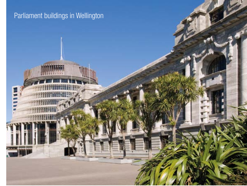
Parliament buildings in Wellington

InterGest New Zealand was formed to assist foreign companies in establishing and developing their business activities in New Zealand and to provide advice and support to New Zealand companies in their international expansion.