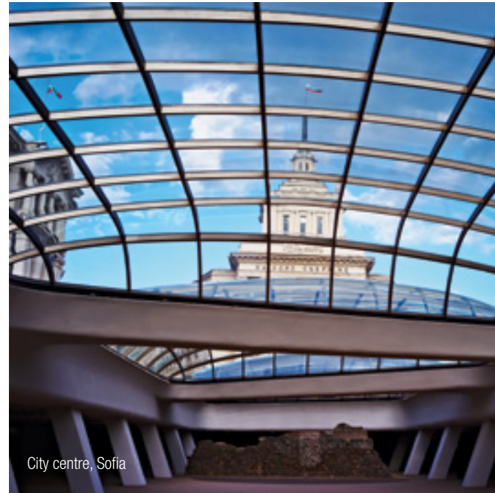
City centre, Sofia

Our experienced InterGest partners will assist you in over 50 countries, from Canada to New Zealand, where a team of around 750 employees currently provides consulting services to approximately 1,700 branches of international companies.