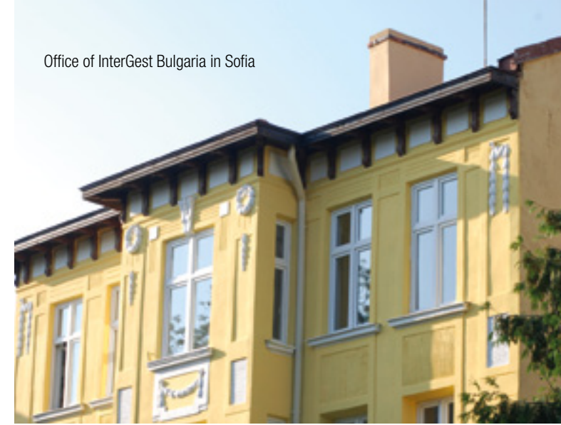
Office of InterGest Bulgaria in Sofia

Intergest Bulgaria was founded in 2001. Its office is located in the City of Sofia, the capital of Bulgaria, nearby the University.