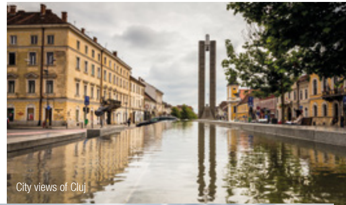
City views of Cluj

Our experienced InterGest partners will assist you in over 50 countries, from Canada to New Zealand, where a team of around 750 employees currently provides consulting services to approximately 1,700 branches of international companies.