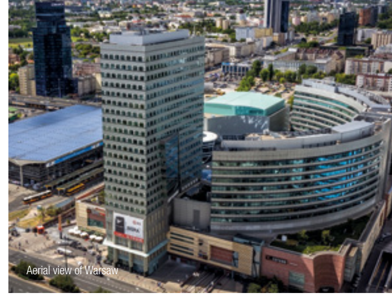
Aerial view of Warsaw