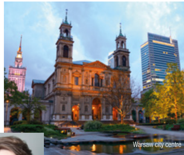
Warsaw city centre

Our experienced InterGest partners will assist you in over 50 countries, from Canada to New Zealand, where a team of around 750 employees currently provides consulting services to approximately 1,700 branches of international companies.