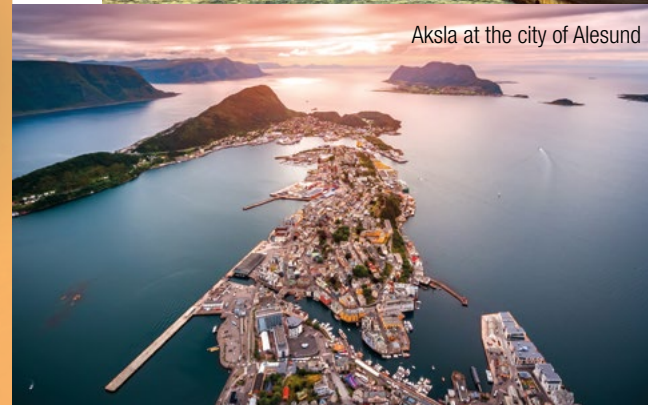
Aksla at the city of Alesund