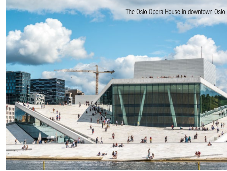
The Oslo Opera House in downtown Oslo

InterGest Norway assists foreign companies in establishing and developing their business activities in Norway and the Nordic region. Our services and systems are designed to assist our clients in developing an optimum concept for the establishment and administration of a branch or subsidiary in Norway and this with one contact person.