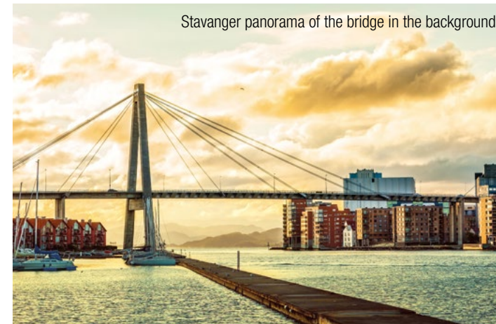
Stavanger panorama of the bridge in the background

Our experienced InterGest partners will assist you in over 50 countries, from Canada to New Zealand, where a team of around 750 employees currently provides consulting services to approximately 1,700 branches of international companies.