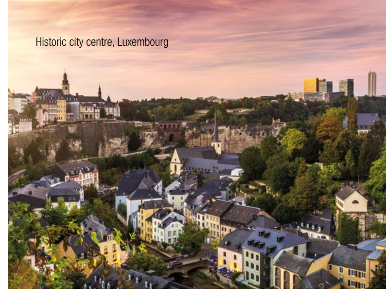
Historic city centre, Luxembourg

InterGest Luxembourg has successfully been helping foreign companies to plan and establish Luxembourg business facilities since 1992. Our well established partner has an in-depth understanding of regional conditions and provides our clients with comprehensive services in Luxembourg Center and Esch-sur-Alzette. InterGest Luxembourg works in close cooperation with one of the country's leading tax consulting and auditing companies, whose access to local know-how and networking opportunities ensure optimum support of our clients around the world.